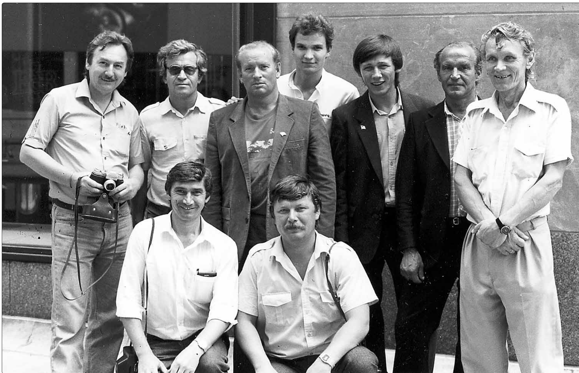
Группа испытателей на Невадском полигоне 1988 г.