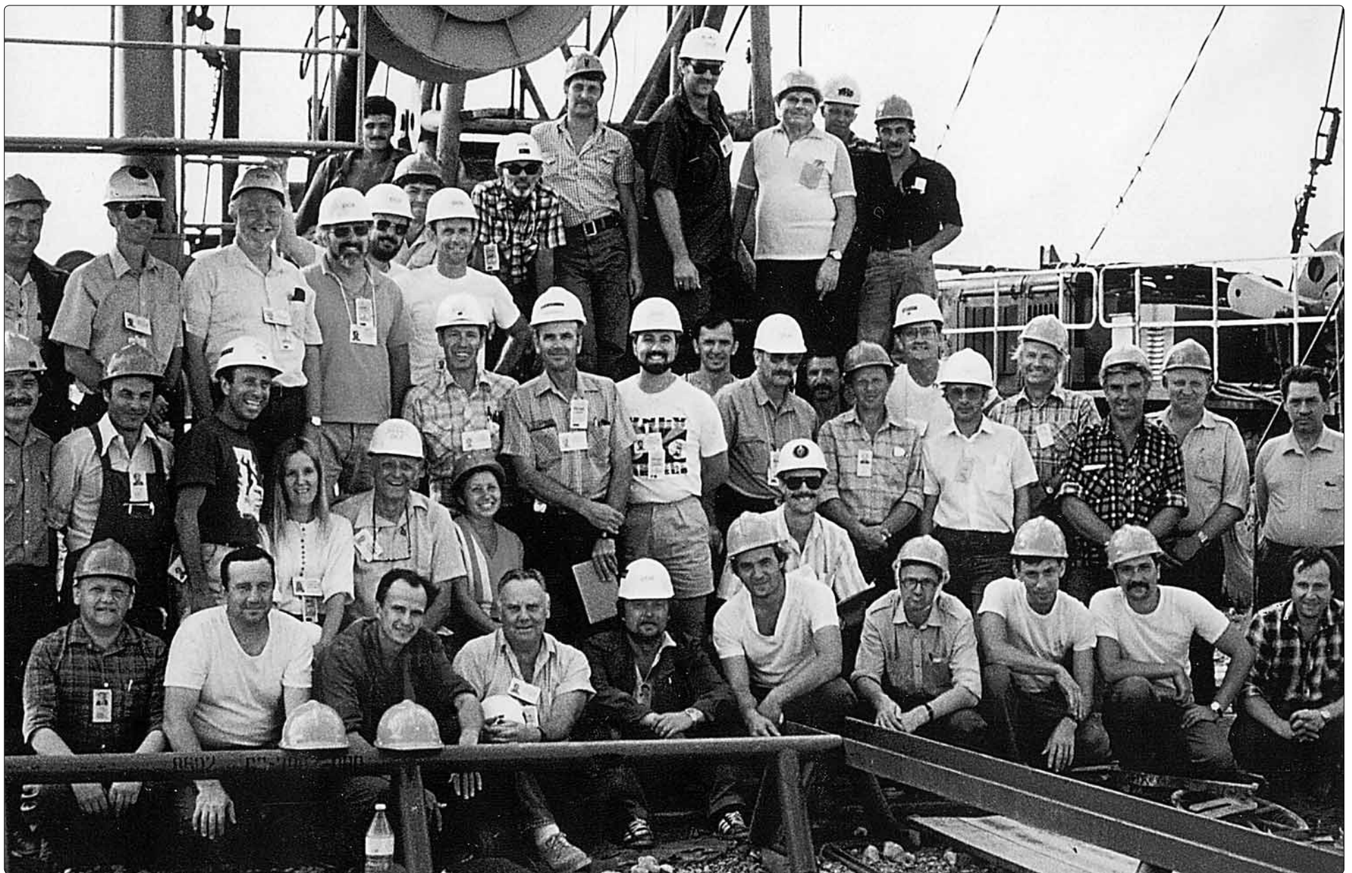
Испытатели СССР и США у скважин СЭК на Семипалатинском полигоне. Сентябрь 1988 г.

Всем им наша признательность за беззаветное служение делу, которому они отдавали и отдадут все свои силы, не кичась значимостью работы и не выпячивая свои заслуги. Спасибо вам, мастера - золотые руки!